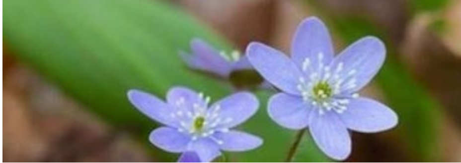
Imagen de jklewis52. Haga clic para ver.